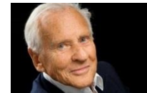
Jean Ormesson 2011