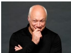
Eric-Emmanuel Schmitt 2008