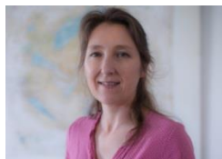
Marie Darrieussecq 2014