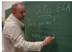
Philippe Claudel 2004