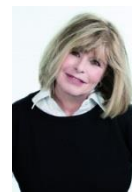
Katerine Pancol 2016

Ils sont comédiens, chanteurs, journalistes, animateurs TV, sportifs de haut niveau, élus locaux... et ils participent à la dictée d'ELA.