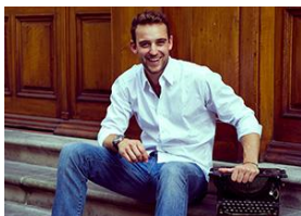
Joël Dicker 2013